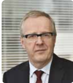
Thierry LE GOFF, Directeur général de l'administration et de la fonction publique

Avec cette formation commune, l'Allemagne et la France offrent une occasion unique de se préparer aux nouveaux enjeux de la coopération administrative en Europe.