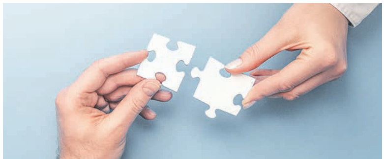
Wenn Kommunalaufsicht und Kommune frühzeitig miteinander arbeiten, werden Haushalte schneller genehmigt, transparenter begründet und nachhaltiger gesteuert.

Kommunen, die ihre Haushaltsplanung frühzeitig mit der Aufsicht