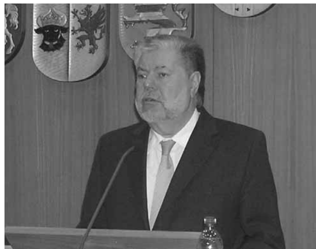
Kurt Beck in der Diskussion mit den Personalräten

Am Abend des 15. März 2012 nahm der rheinland-pfälzische Ministerpräsident Kurt Beck in der Aula der Deutschen Universität für Verwaltungswissenschaften Speyer an einer der regelmäßigen Betriebs- und Personalrätekonferenzen des DGB teil.