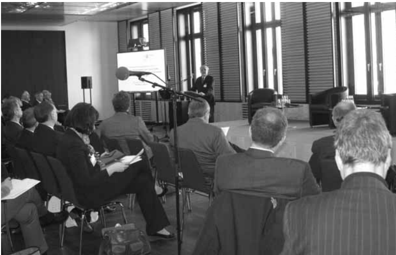
Auf großes Interesse stieß das 4. Speyerer Energieforum

Namhafte Experten aus der öffentlichen Verwaltung und Energiewirtschaft diskutierten unterschiedliche Sichtweisen zu Kernenergieausstieg und Energiewende in Form von Rede und Gegenrede.