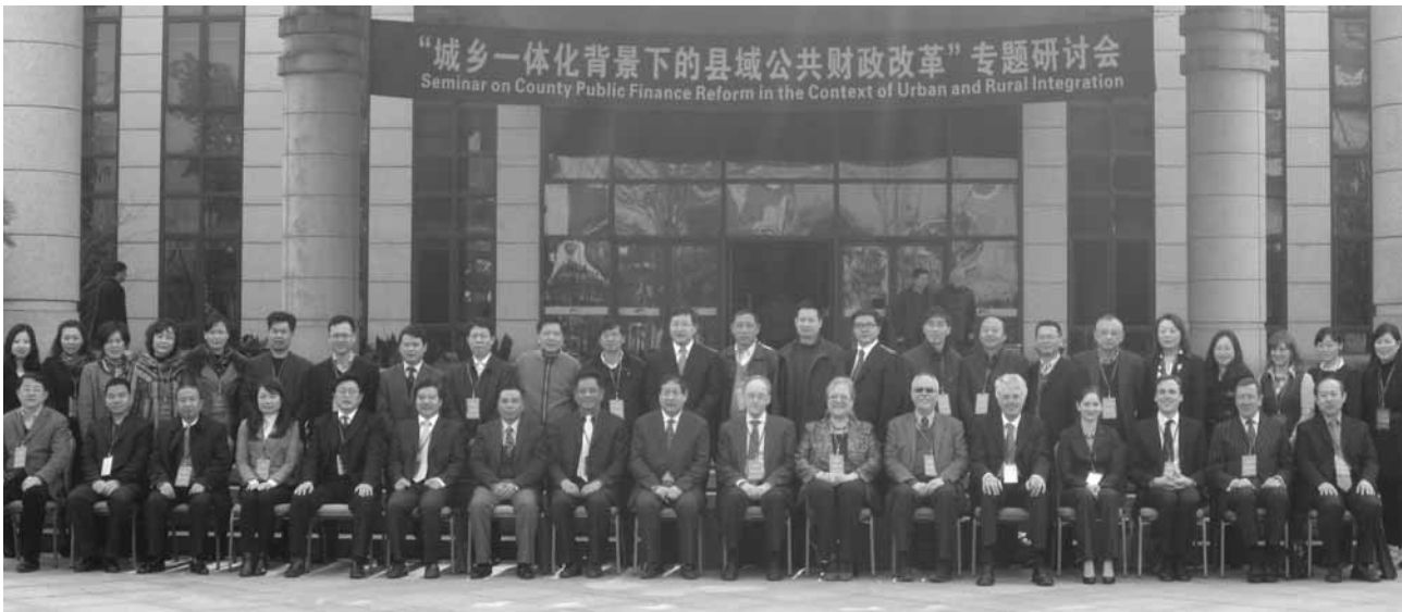
Die Teilnehmer des 3. Workshops mit der Chinese Academy of Governance in Hangzhou (VR China)