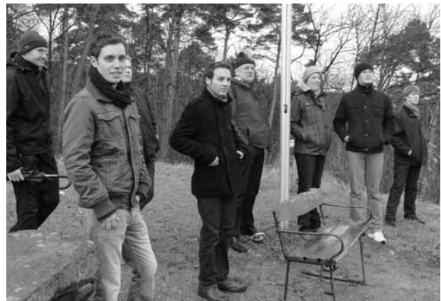
Ausflug nach Deidesheim