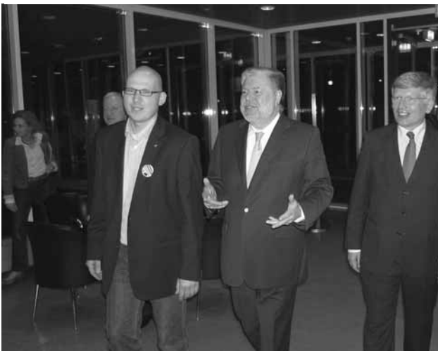
Ankunft des Ministerpräsidenten