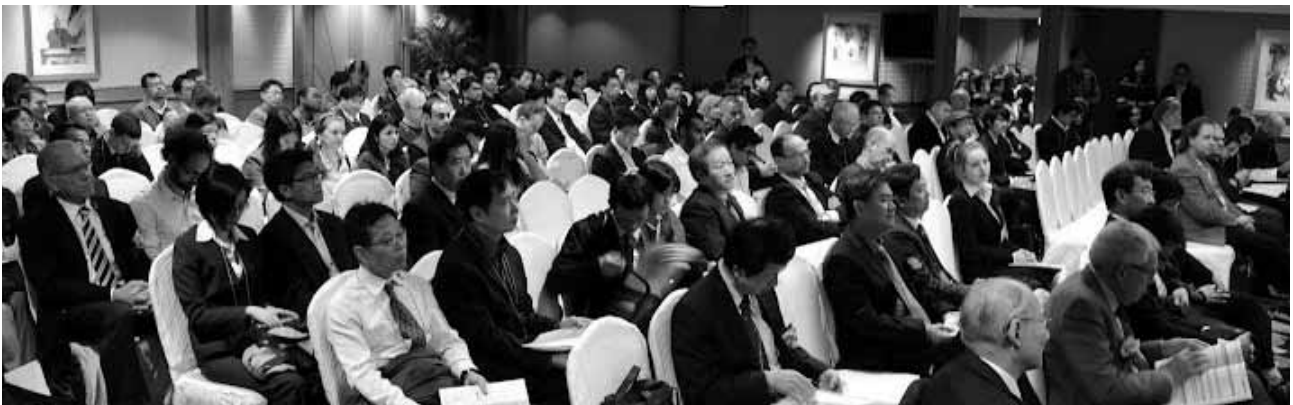
Die Teilnehmer des 16 th International Conference of Hong Kong Society for Transportation Studies (HKSTS)