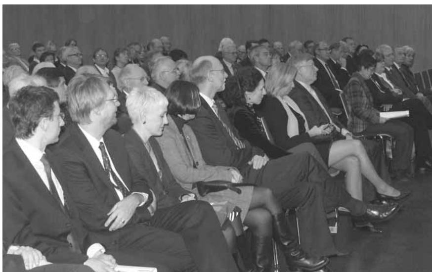
Feierlicher Semesterauftakt in der Aula