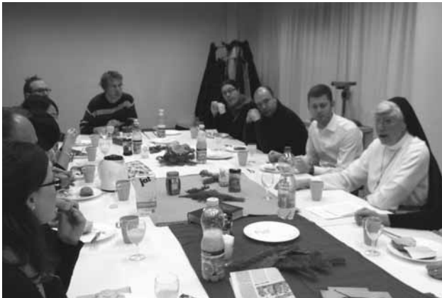
Morgenimpuls im Clubraum 3