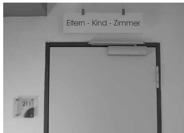
Das neue Eltern-Kind-Zimmer in der 2. Etage des Wohnheimes

Das Eltern-Kind-Zimmer verfügt über Schlaf- und Spielmöglichkeiten für das Kind, einen eigenen Sanitärbereich mit Nasszelle, Wickeltisch und unterstützt mit seinen vielseitigen Möglichkeiten die Betreuung von Kindern. Ebenso dient der Raum als Ruheort für Schwangere oder Stillende.